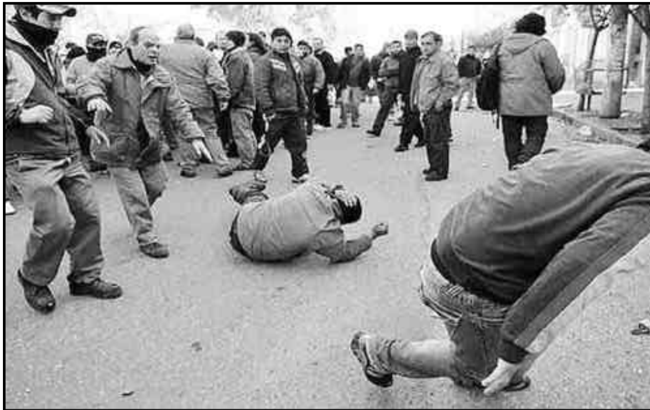
Obreros de base de la UOM-Córdoba se enfrentan a la burocracia entregadora.

DO: ¿Sabían que dentro estaba Varas y otros dirigentes?