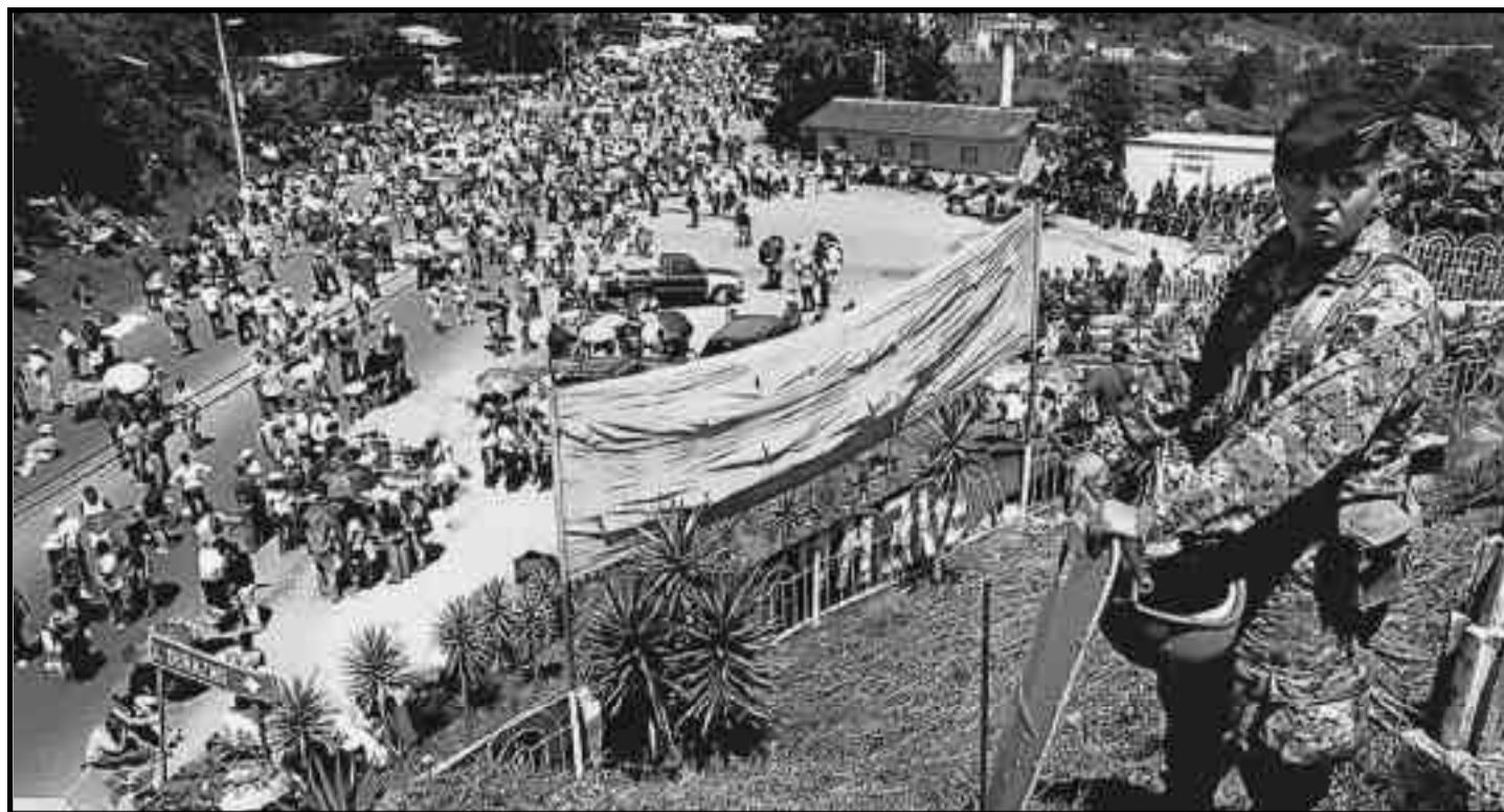
Las masas rodean el aeropuerto militarizado de Tegucigalpa.

Pero más allá de esa “desprolijidad”, es claro que sólo una irrupción revolucionaria de las masas hondureñas podrá impedir que el imperialismo imponga una salida y una relación de fuerzas a su favor, ya sea que termine por imponerse el golpe con Micheletti manteniendo el poder hasta las elecciones de los próximos