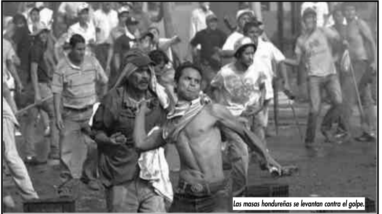
Las masas hondureñas se levantan contra el golpe.

Aprobada por el Congreso de Fundación de la Fracción Leninista Trotskista Internacional – Julio 2009