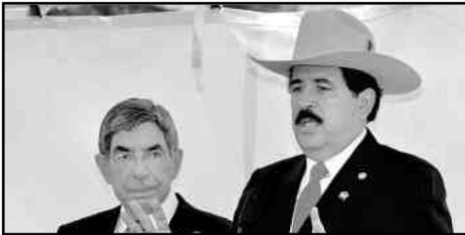
El presidente Arias junto a Zelaya (arriba) y con Micheletti (abajo)

Hoy, los revolucionarios decimos con claridad: ¡por una nueva Cuba en Honduras, por una nueva Cuba en Nicaragua, por una Cuba en Haití, en Guadalupe y Martinica, en toda Centroamérica y el Caribe, pero no nuevas Cuba stalinistas, sino bajo una genuina dictadura revolucionaria del proletariado, dirigida por los soviets de obreros y campesinos! ¡Por la revolución política en Cuba para que haya una Cuba verdaderamente revolucionaria, sin burócratas castristas que, de la mano de Obama, se preparan a consumir la restauración capitalista! ¡Por los Estados Unidos socialistas de Centroamérica y el Caribe donde la clase obrera y los explotados hablen español, créole y francés como en Haití, República Dominicana y las Antillas, inglés como en Jamaica, Trinidad y Tobago y Granada, u holandeses como en Curaçao o Aruba; liberados de todos los imperialistas franceses, británicos, holandeses y norteamericanos, y