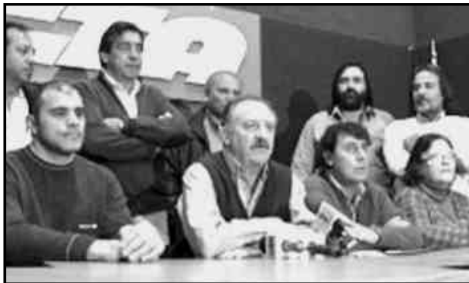
Dellacarbonara, delegado del Subte y dirigente del PTS junto al burócrata Yasky en la Conferencia de Prensa de la CTA.

Lamentablemente, los renegados del trotskismo junto al PCR-CCC pusieron