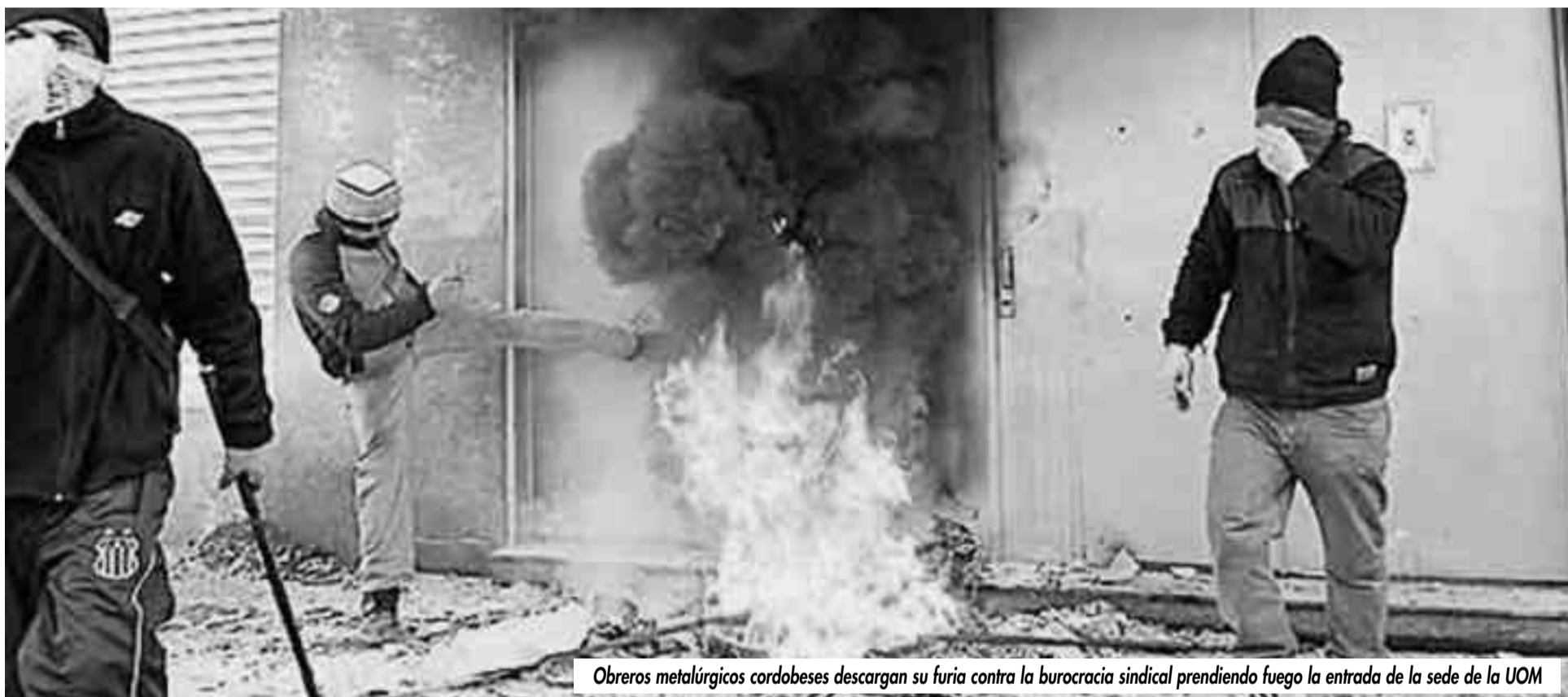
Obreros metalúrgicos cordobeses descargan su furia contra la burocracia sindical prendiendo fuego la entrada de la sede de la UOM

Ellos marcan el camino a todo el movimiento obrero para enfrentar al ataque patronal