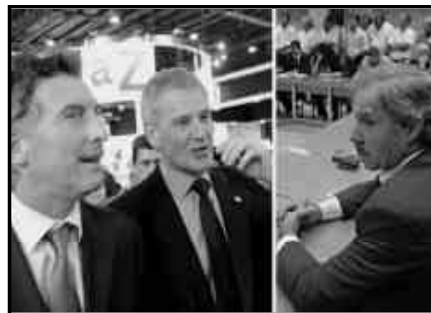
Macri, De Narváez y Solá festejan su triunfo (arriba). Los trabajadores despedidos en Tersuave tras las elecciones no tienen nada que festejar (abajo)

Pero algo tiene que quedar en claro: sí los trabajadores no pudieron derrotar la farsa electoral y fueron sometidos a la misma bajo el ataque directo de la patronal y el gobierno, fue por la burocracia de la CGT y la CTA y la izquierda reformista que entregaron cada lucha de los obreros contra este régimen infame, poniéndolas a los pies de cada una de las fracciones burguesas que estaban en pugna. Fueron ellos los que lleva-