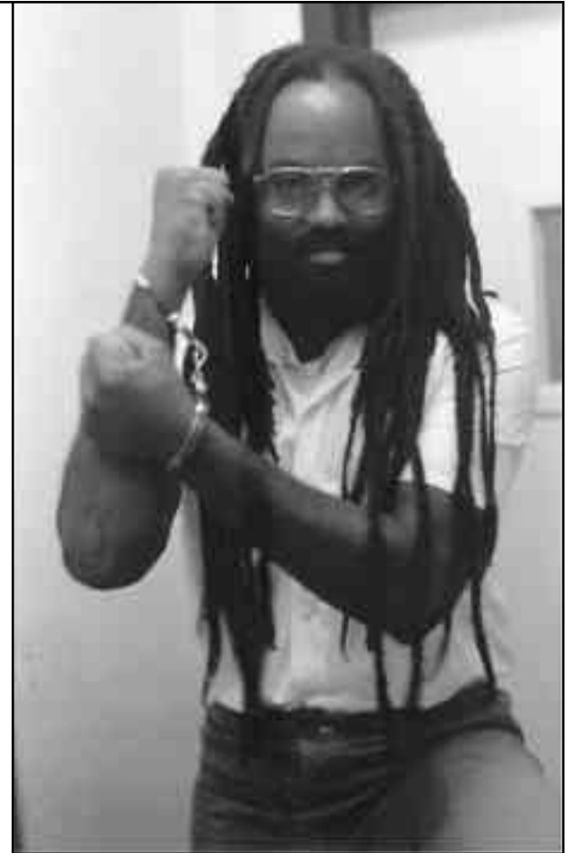
Mumia Abu Jamal

Reunidos en Buenos Aires, trabajadores revolucionarios de las minas de Bolivia, de las fábricas chilenas y argentinas, del sector del transporte de Sudáfrica, de las fábricas de Brasil, desde Nueva Zelanda y Oakland, Estados Unidos, afirmamos nuestro compromiso de llamar a y de construir una acción huelguística para liberar a nuestro hermano. Condenamos al NAACP (National Association for the Advancement of Colored People/Asociación Nacional por el Avance de la gente de color) por recibir al Fiscal General norteamericano Eric